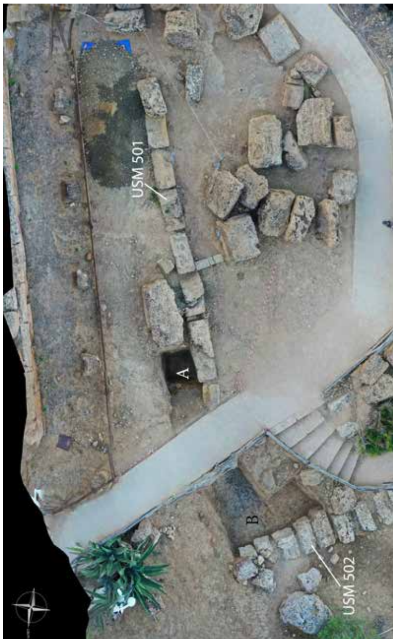
1. Agrigento. Foto zenitale da drone dell'area a Ovest del tempio D con l'indicazione delle due strutture murare e dei saggi aperti nella campagna di scavo del 2022.