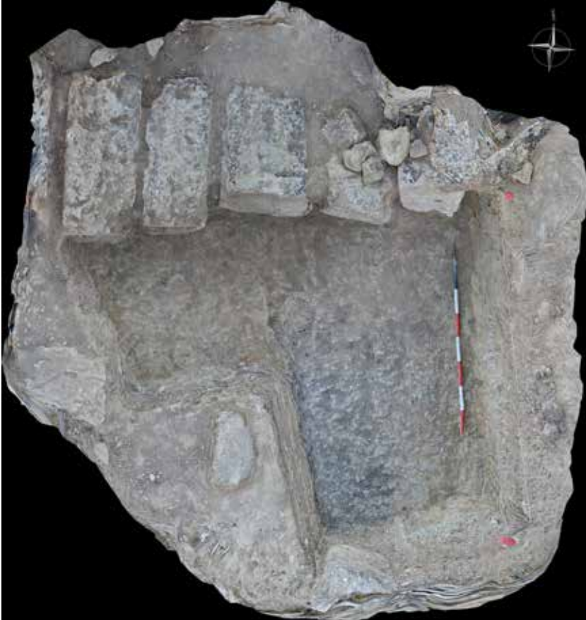
3. Agrigento. Area a Ovest del tempio D. Fotogrammetria del saggio a Nord dell'USM 501 a scavi conclusi (elaborazione di C. Cassanelli).