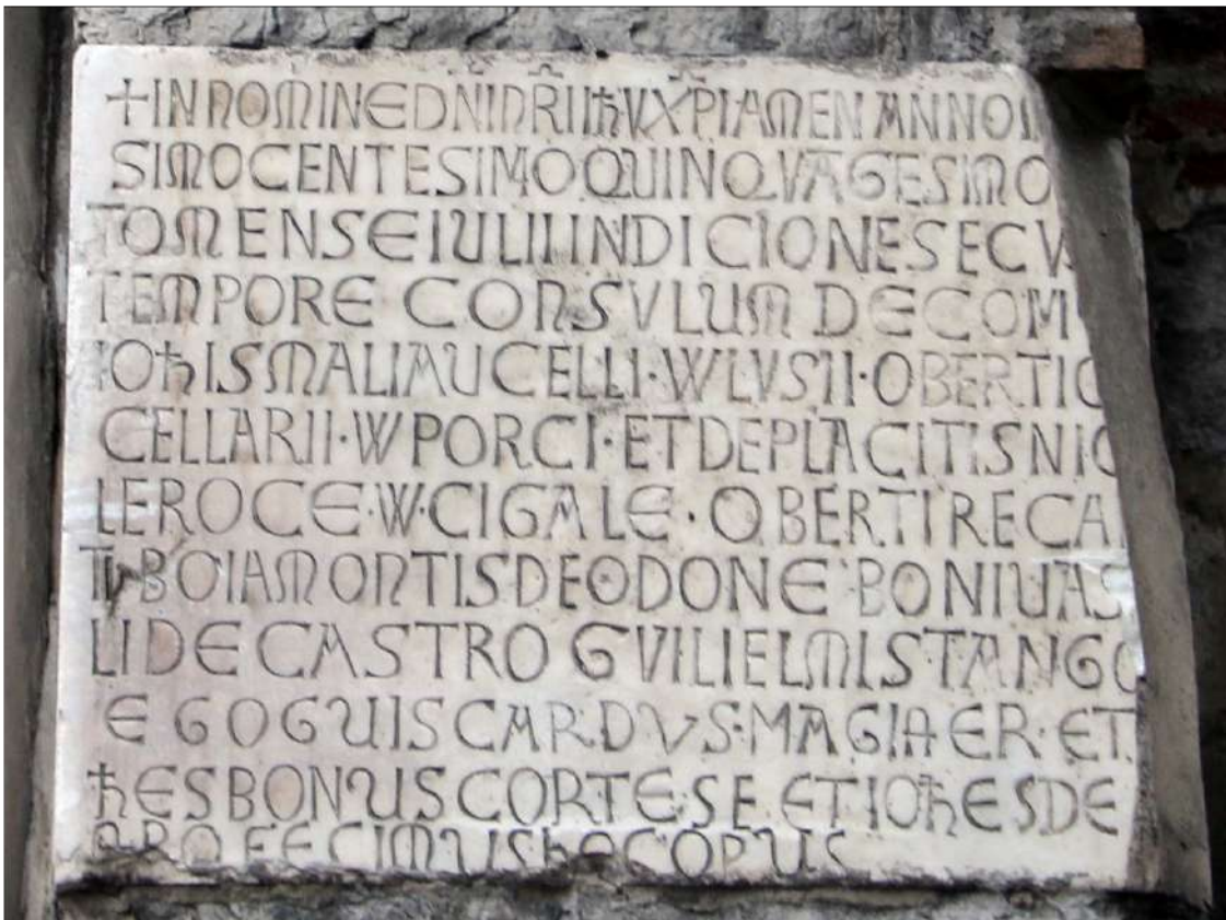
Tavola 4, Porta dei Vacca lato nord:

copyright Wikimedi a Common s: https://commons.wikimedia.org/wiki/File:Porta_dei_vacca_lapide_01.JPG consultat o il 9 gennaio 2022