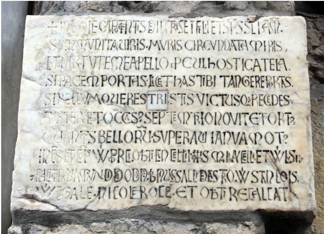
Tavola 1, iscrizione di Porta Soprana, lato sud (PSS):