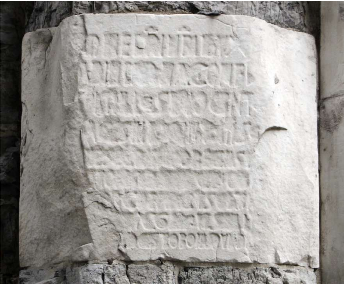
Tavola 3, Porta dei Vacca lato sud: