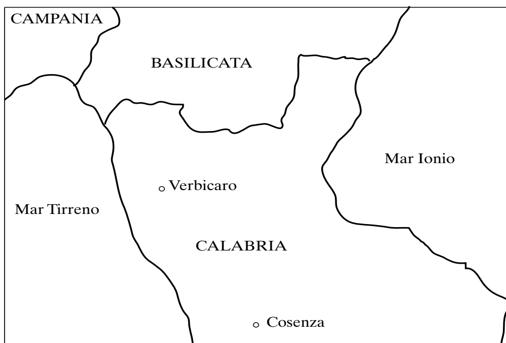
Figura 1. Posizione geografica di Verbicaro

diretto lessicale, infatti (il tipo Gianni ha mangiato la mela ), l'accordo si mantiene (come nei dialetti alto-meridionali più conservativi) solo se il participio presenta flessione interna metafonetica, mentre è agrammaticale se il participio ha flessione esclusivamente affissale (v. il §5.2). Di questa particolarità, che il verbicarese condivide con alcuni altri dialetti parlati entro l'area Lausberg o nelle immediate vicinanze, si offrirà un inquadramento geolinguistico al §7, dopo aver perfezionato al §6 la descrizione delle condizioni verbicaresi con l'analisi delle differenze che il dialetto innovativo oggi presenta rispetto a quello dei più anziani: l'innovazione consiste nel divenire opzionale dell'accordo in tutti i costrutti riflessivi, che invece lo presentano categoricamente nel verbicarese conservativo. Anche questo mutamento in corso, così come la perdita selettiva dell'accordo con l'oggetto diretto lessicale (fronte quest'ultimo sul quale le due varietà verbicaresi non si differenziano), si inquadra entro la generale deriva diacronica romanza che ha visto una progressiva riduzione dell'accordo del participio passato nelle perifrasi verbali perfettive.