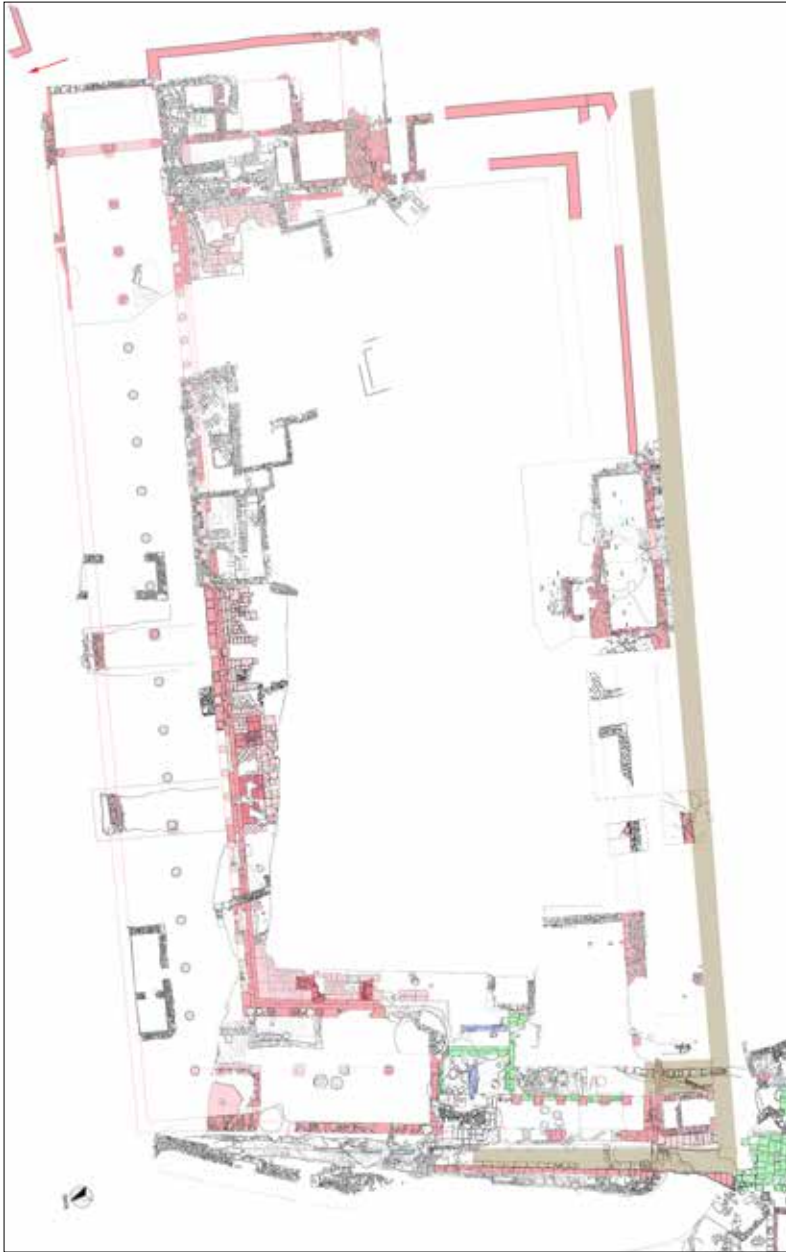
3. Segesta. Pianta plurifase dell'agora (in beige i percorsi viari verso il teatro e verso l'ala Est della stoa Nord).