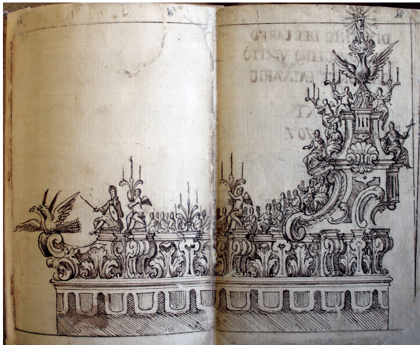
Fig. 2: Carlo Antonio Sammarco, Carro di Battaglino del 21 aprile 1708 , dal Giornale e sommario dal giorno che entrorno in Capua l'arme impeiale [sic] con tutto quello che soccede alla giornata, dali II di luglio 1707 per tutto la giornata di oggi , c. 44r. Napoli, Biblioteca Nazionale "Vittorio Emanuele III", ms. XIII B 87su concessione del Ministero della Cultura - Biblioteca Nazionale di Napoli (foto dell'autore)