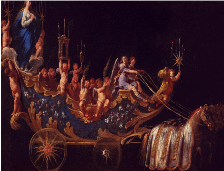
Fig. 1: Andrea Vaccaro, Il carro di Battaglino , Vaglia (Firenze), Fondazione De Vito, inv. 39. Diritti: Fondazione Giuseppe e Margaret De Vito per la Storia dell'Arte Moderna a Napoli. Fotografo Claudio Giusti, Firenze