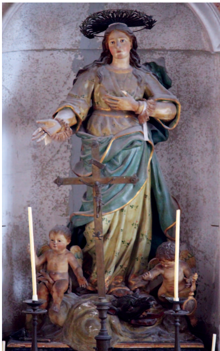
Fig. 4: Ferdinando Parascandolo, Immacolata Concezione , 1771. Napoli, oratorio dell'Arciconfraternita dell'Immacolata Concezione e Purità di Maria dei Nobili di Montecalvario