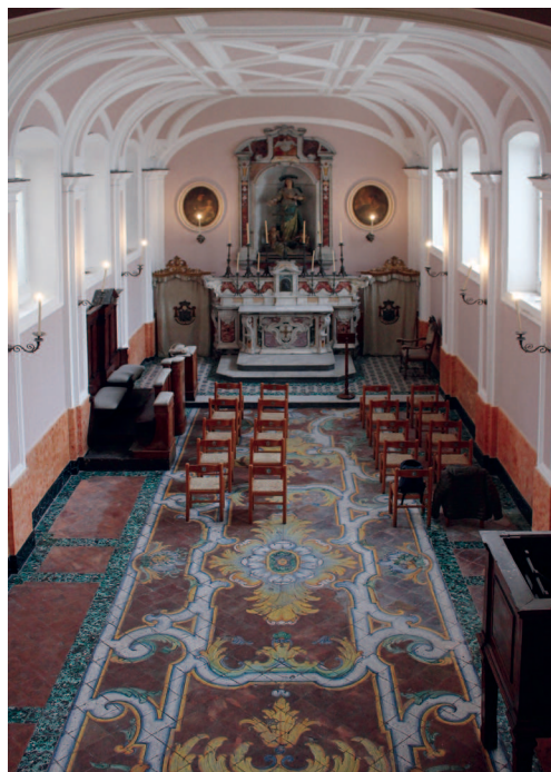
Fig. 5: Francesco Colella su disegno di Gennaro Campanile, altare maggiore e nicchia dell'Immacolata, 1743. Giuseppe Massa su disegno di Claudio Maturanzio, pavimento, 1756. Napoli, oratorio dell'Arciconfraternita dell'Immacolata Concezione e Purità di Maria dei Nobili di Montecalvario