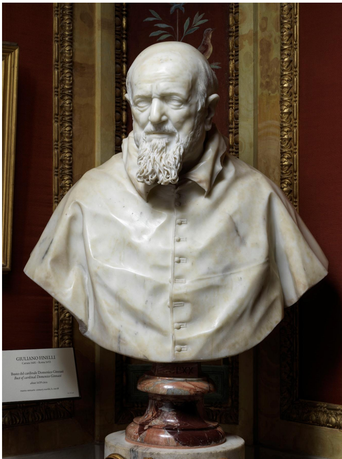
Fig. 2: Giuliano Finelli, Ritratto del cardinale Domenico Ginnasi , 1630 ca., Roma, Galleria Borghese, inv. CCLXX