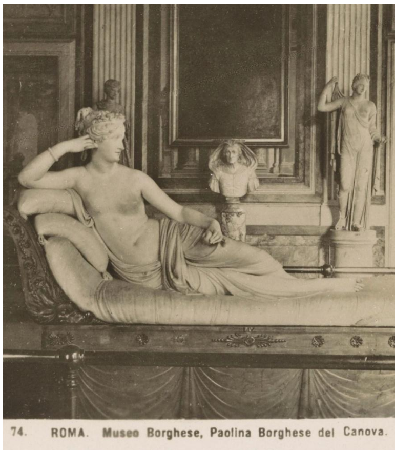
Fig. 3: Neue Photographische Gesellschaft, «74. Roma, Museo Borghese, Paolina Borghese del Canova», post 1907 - ante 1914, Amsterdam, Rijksmuseum, inv. RP-F-00-9176 (Public Domain)