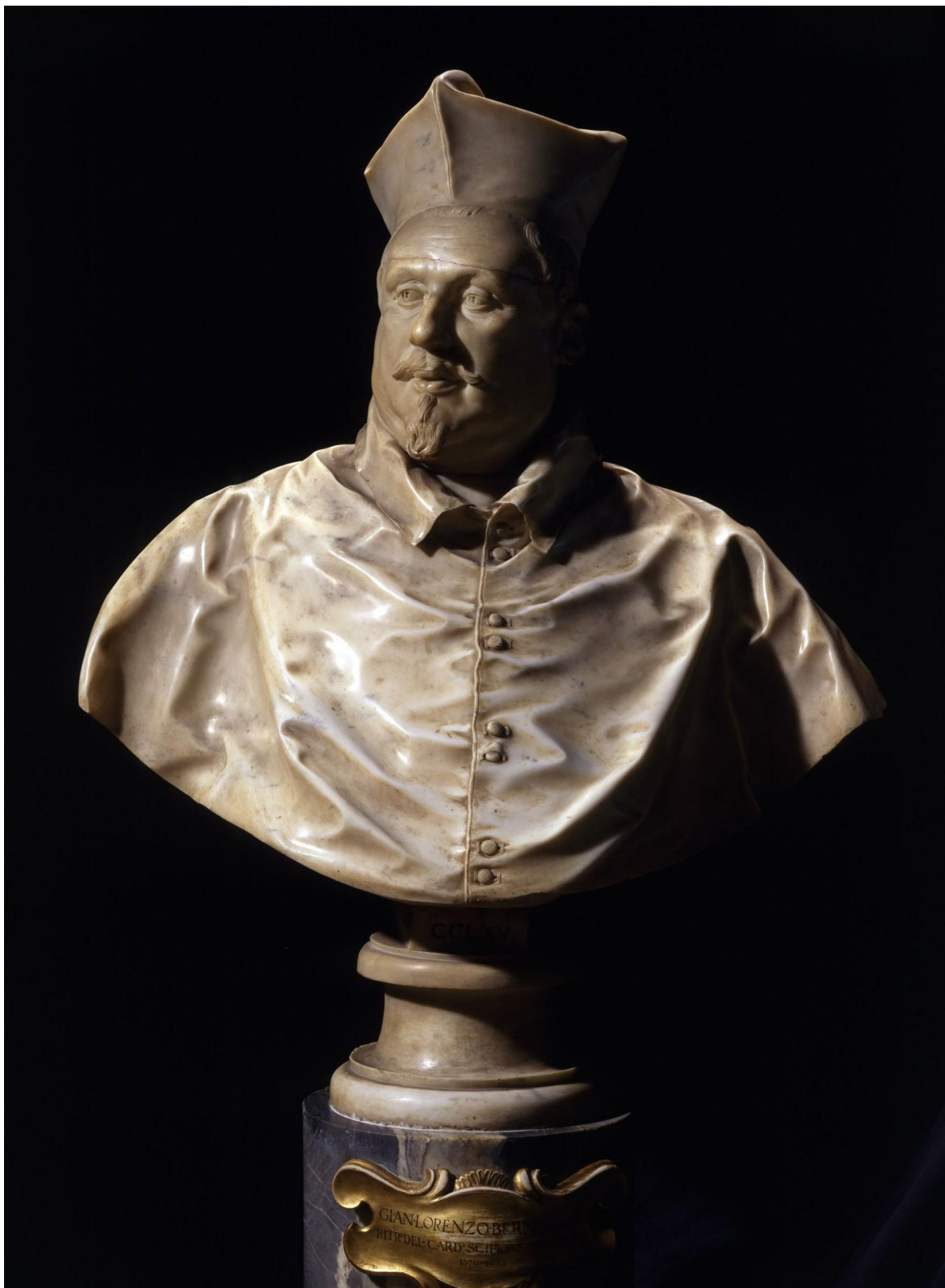
Fig. 1: Gian Lorenzo Bernini, Ritratto del cardinale Scipione Borghese , 1632, Roma, Galleria Borghese, inv. CCLXV