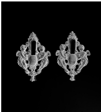
Fig. 17 – Manifattura italiana, Copriserratura con puttini alati , dono del Conte Renato Pace, Roma, Galleria Nazionale d'Arte Antica di Palazzo Barberini

qualità, risalenti al XIV-XV secolo, e alle quali la Brugnoli, divenuta direttrice di Palazzo Venezia, dedicò alcune schede pubblicate sia nel «Bollettino d'Arte» che nei cataloghi relativi all'attività di restauro della Soprintendenza e una piccola esposizione nell'appartamento Barbo.