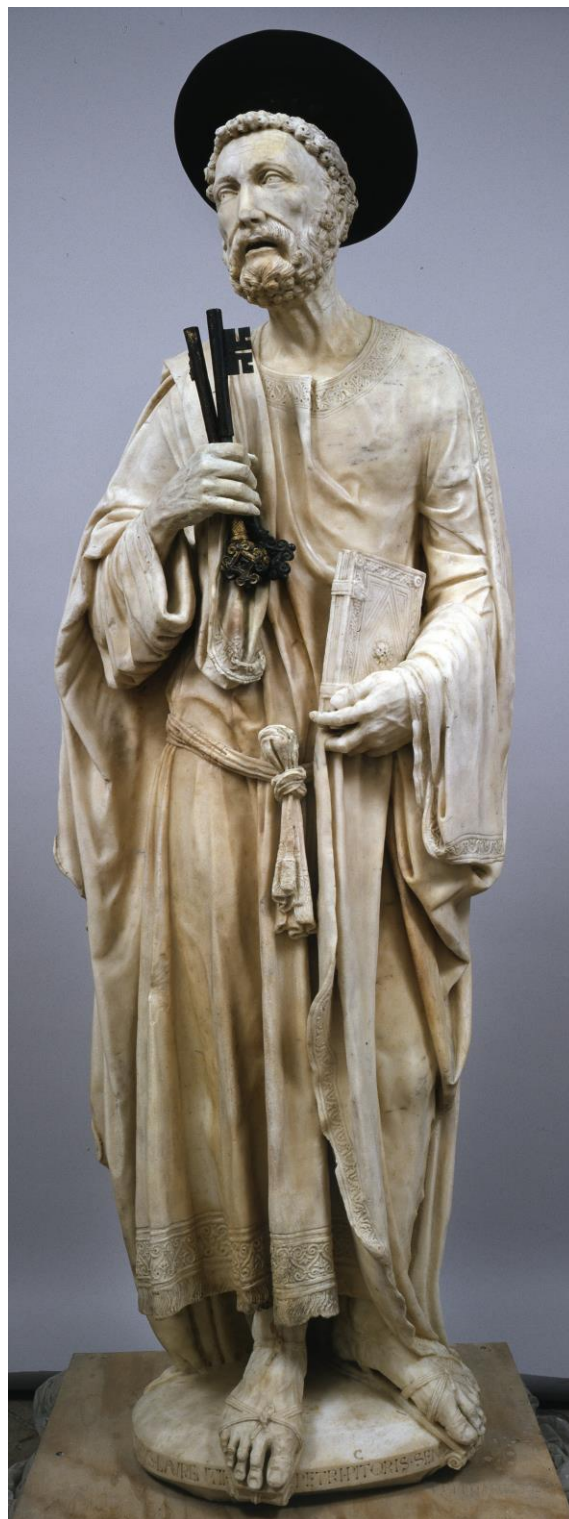
Fig. 5: Lorenzo di Pietro detto il Vecchietta, S. Pietro , 1460-1462. Siena, Complesso Museale di Santa Maria della Scala (dalla Loggia della Mercanzia)