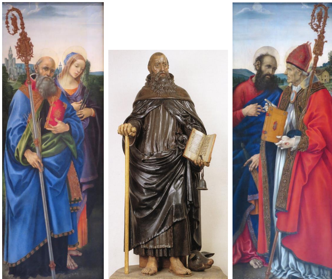
Fig. 3: Benedetto da Maiano e Filippino Lippi, frammenti della Pala di S. Antonio abate già nella chiesa di Santa Maria del Corso a Lucca, 1482-1483 (3a / 3c: Filippino Lippi, S. Apollonia e S. Benedetto e S. Paolo e un santo vescovo (Nicola?) . Pasadena (California), Norton Simon Museum; 3b: Benedetto da Maiano, S. Antonio abate . Lucca, Museo Nazionale di Villa Guinigi)