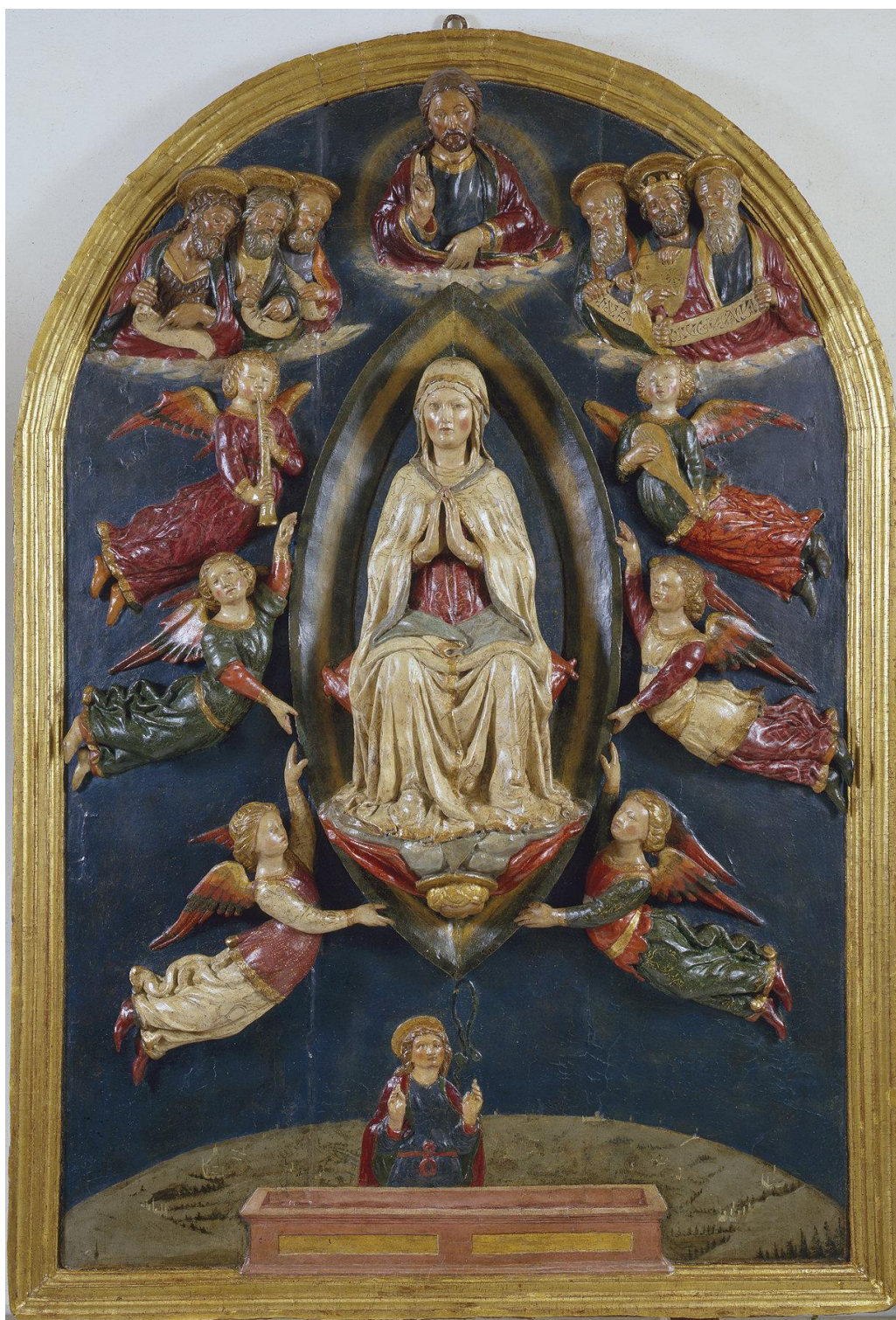
Fig. 10: Neroccio di Bartolomeo de' Landi, Assunzione della Vergine , 1475 circa. Montemerano (Grosseto), chiesa di San Giorgio