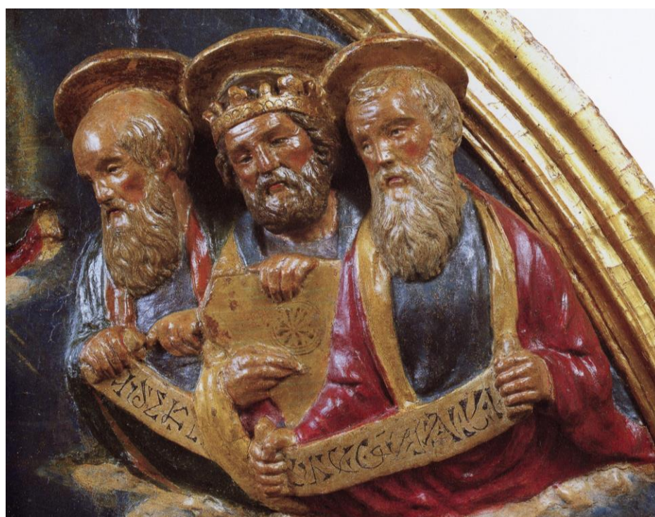
Figg. 13-14: Neroccio di Bartolomeo de' Landi, Assunzione della Vergine (particolari). Montemerano (Grosseto), chiesa di San Giorgio