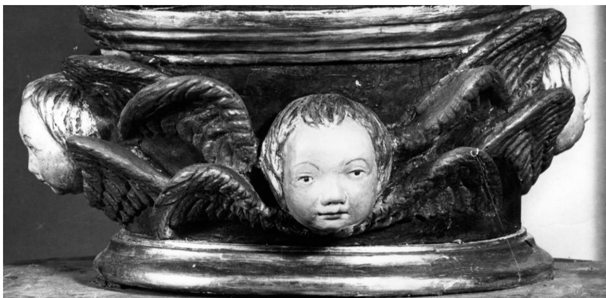
Fig. 19: Neroccio di Bartolomeo de' Landi, Santa Caterina da Siena (particolare). Siena, oratorio di Santa Caterina in Fontebranda