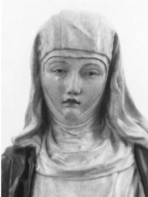
Fig. 6: Neroccio di Bartolomeo de' Landi, S. Caterina da Siena , 1474 (particolare). Siena, oratorio di Santa Caterina in Fontebranda