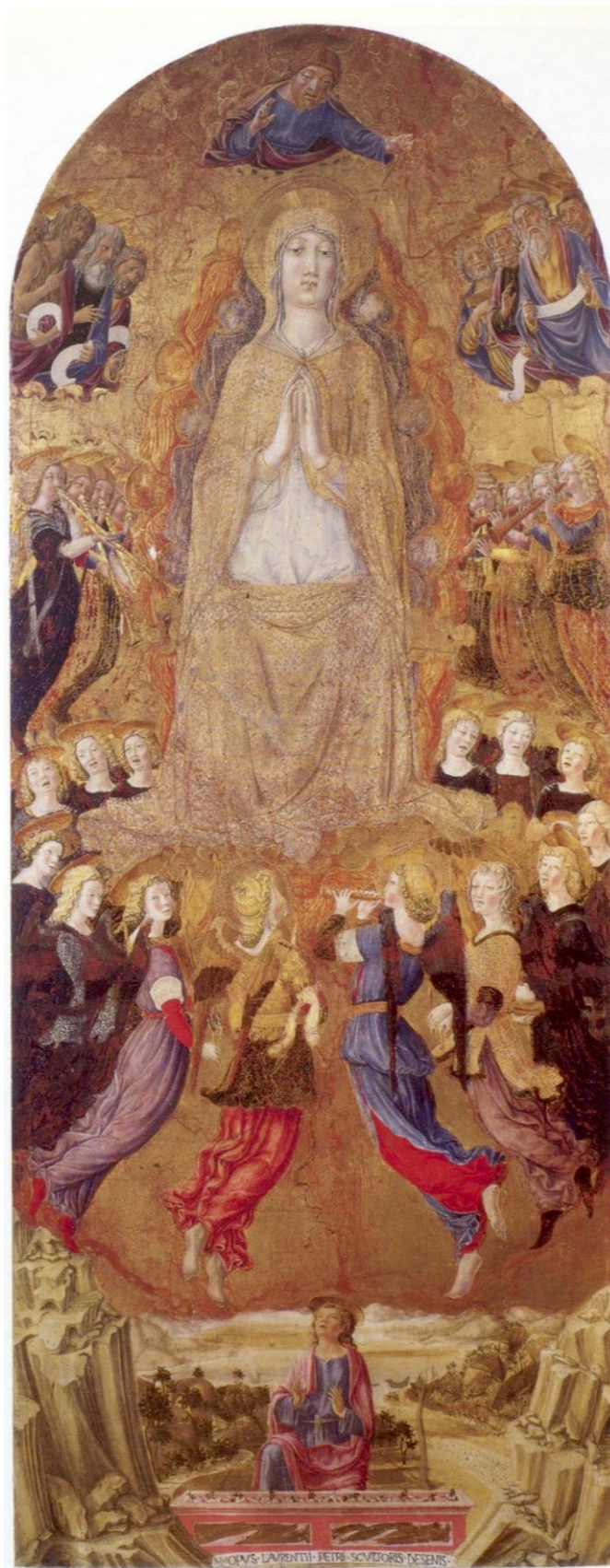
Fig. 9: Lorenzo di Pietro detto il Vecchietta, Pala dell'Assunta , entro il 1462 (particolare con il pannello centrale). Pienza, Cattedrale