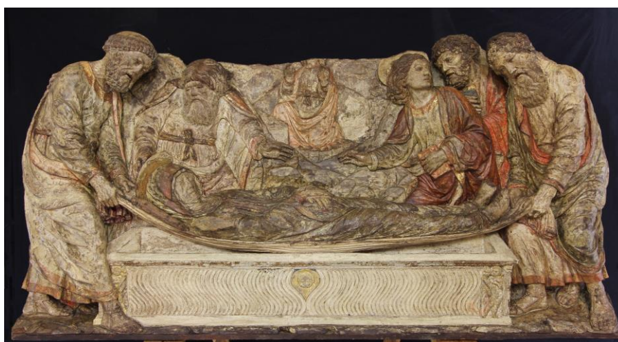
Fig. 1: Lorenzo di Pietro detto il Vecchietta e Neroccio di Bartolomeo de' Landi, Seppellimento e Assunzione della Vergine , frammenti della Pala dell'Assunta già nella chiesa di Santa Maria del Corso a Lucca, 1477-1482. Lucca, Museo Nazionale di Villa Guinigi