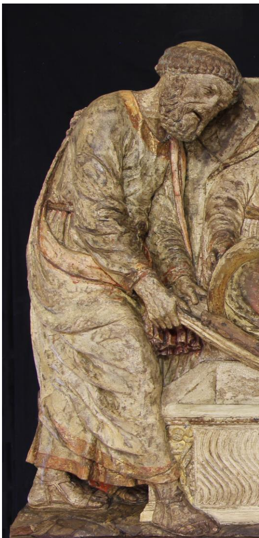
Fig. 4: Lorenzo di Pietro detto il Vecchietta (con Neroccio di Bartolomeo de' Landi), Sepellimento della Vergine (particolare). Lucca, Museo Nazionale di Villa Guinigi