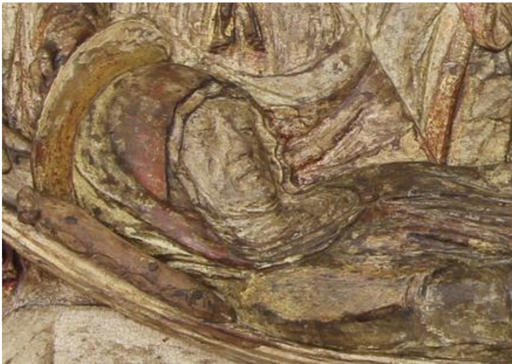
Fig. 8: Lorenzo di Pietro detto il Vecchietta (con Neroccio di Bartolomeo de' Landi), Seppellimento della Vergine (particolare). Lucca, Museo Nazionale di Villa Guinigi