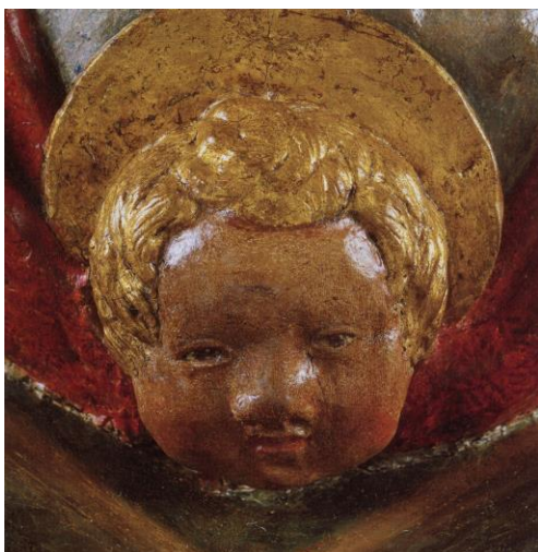
Fig. 16: Neroccio di Bartolomeo de' Landi, Assunzione della Vergine (particolare). Montemerano (Grosseto), chiesa di San Giorgio