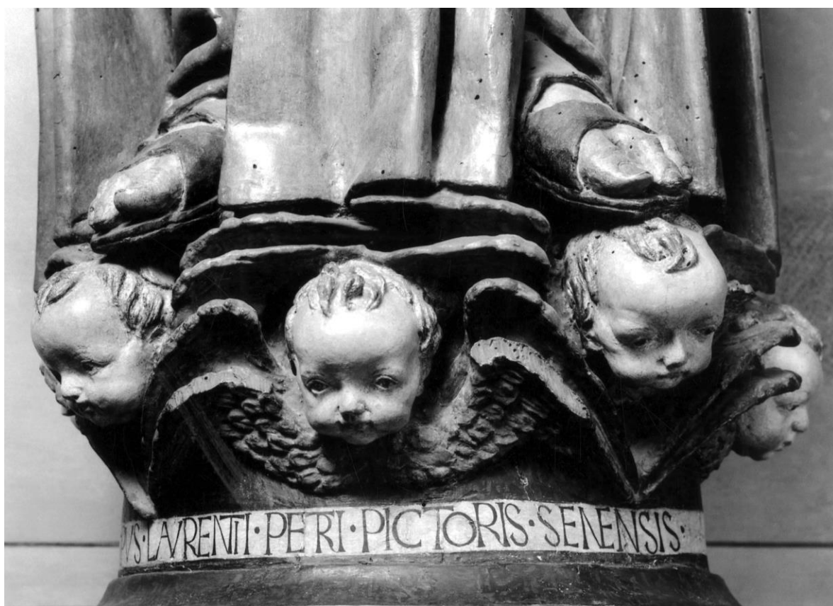
Fig. 18: Lorenzo di Pietro detto il Vecchietta, San Bernardino da Siena , 1460-1464 circa (particolare). Firenze, Museo Nazionale del Bargello (dalla chiesa di San Francesco a Narni)