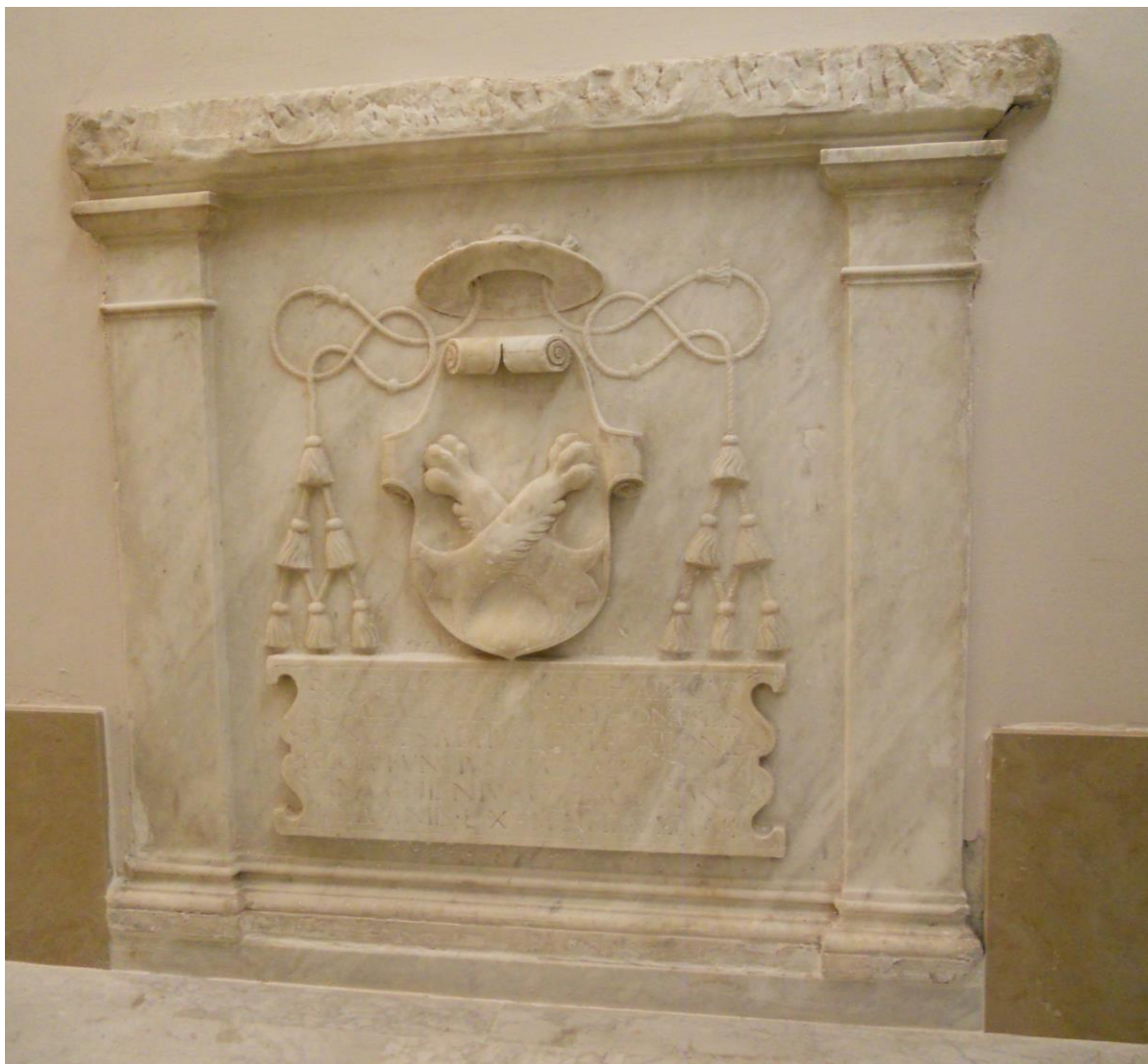
Fig. 21: Epitaffio di Bartolomeo Arnolfini († tra il 1536 e il 1540). Lucca, chiesa di San Ponziano (oggi biblioteca della Scuola IMT Altissimi Studi di Lucca)