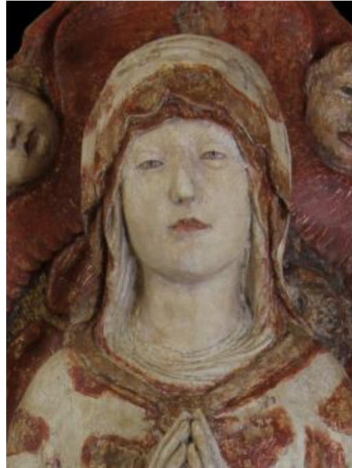
Fig. 7: Neroccio di Bartolomeo de' Landi (con Lorenzo di Pietro detto il Vecchietta), Assunzione della Vergine (particolare). Lucca, Museo Nazionale di Villa Guinigi