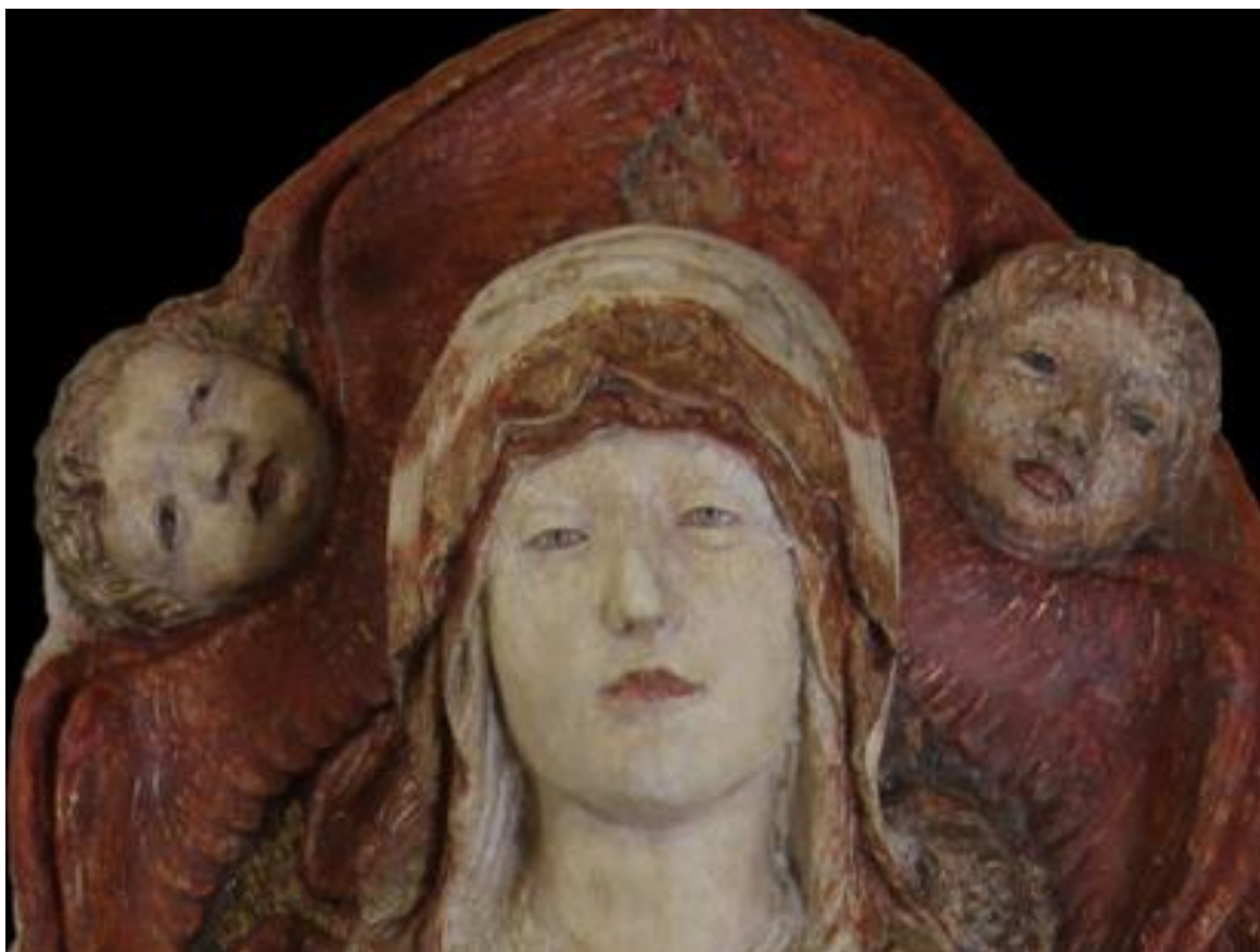
Fig. 15: Neroccio di Bartolomeo de' Landi (con Lorenzo di Pietro detto il Vecchietta), Assunzione della Vergine (particolare). Lucca, Museo Nazionale di Villa Guinigi