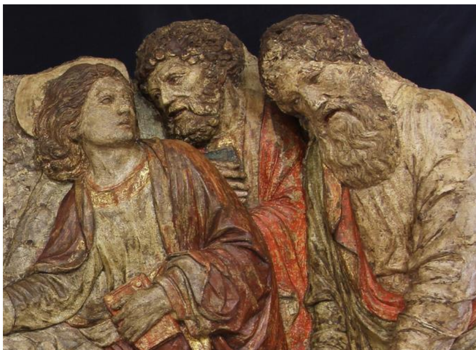
Figg. 11-12: Lorenzo di Pietro detto il Vecchietta (con Neroccio di Bartolomeo de' Landi), Seppellimento della Vergine (particolari). Lucca, Museo Nazionale di Villa Guinigi