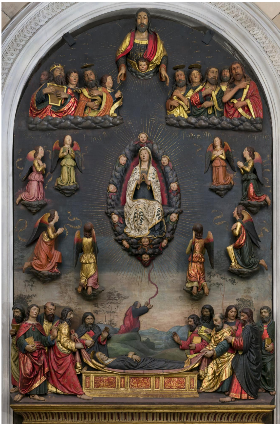
Fig. 2: Masseo Civitali, Seppellimento e Assunzione della Vergine , 1510 circa. Lucca, basilica di San Frediano, Cappella Micheli