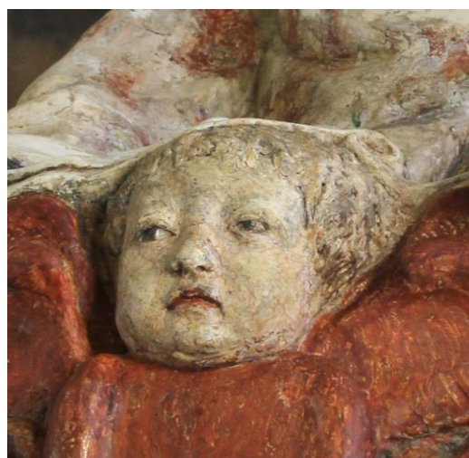
Fig. 17: Neroccio di Bartolomeo de' Landi (con Lorenzo di Pietro detto il Vecchietta), Assunzione della Vergine (particolare). Lucca, Museo Nazionale di Villa Guinigi