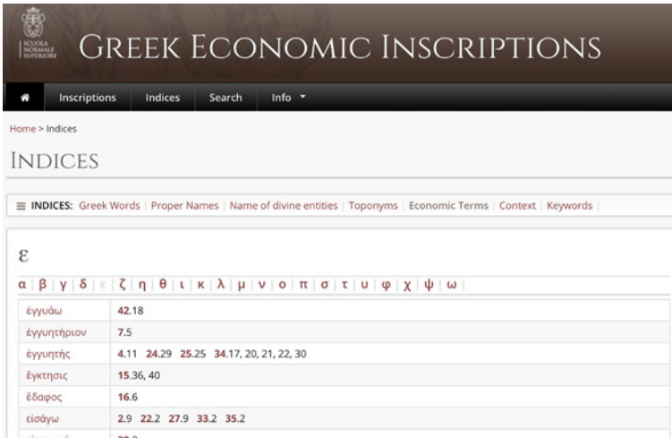
Figura 7 Dettaglio dell'indice dei termini economici, lettera epsilon

Completano il sito alcune sezioni informative, cui si accede dal tag 'info'. La sezione 'bibliography' presenta i riferimenti bibliografici presenti nel campo bibliografico di ciascuna scheda epigrafica, mentre 'abbreviations' raccoglie tutte le abbreviazioni dei repertori epigrafici. Altre sezioni, invece, contengono dati informativi relativi al progetto, da 'help', come si è detto prima, a 'staff', in cui figurano tutte le persone che hanno partecipato al progetto a diverso titolo, dagli autori dei contenuti scientifici a quanti si sono occupati dell'elaborazione tecnica. Una lista che ci auguriamo possa ampliarsi nel tempo.