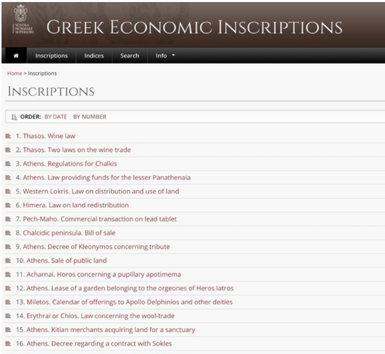
Figura 3 Schermata del menu 'Inscriptions' con l'indice delle iscrizioni e i due tab che consentono l'ordinamento per sequenza di inserimento o per cronologia

sivamente nella bibliografia generale posta in calce al commento, insieme ai saggi che vengono utilizzati per il commento stesso e che non sono relativi all'iscrizione in oggetto.