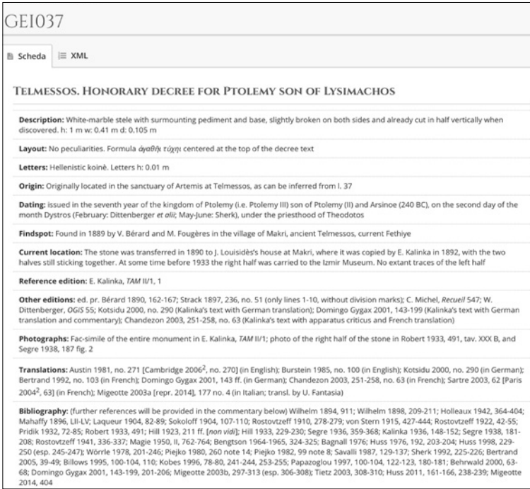
Figura 4 Sezione iniziale della scheda di GEI 37

dipendenza di Telmessos dalla dinastia Lagide e sull'identificazione del personaggio onorato, vengono particolarmente valorizzati i diversi aspetti e le procedure della riforma fiscale (modalità di misurazione dei prodotti solidi; tipologia di prelievo fiscale per i casi di riduzione delle imposte; descrizione dei prodotti per i quali Tolemeo aveva stabilito l'esenzione dalle tasse; magistrati competenti, ecc.) e il lessico tecnico utilizzato.